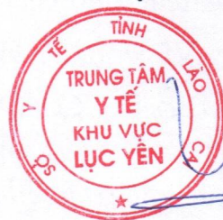
Trần Trung Thành